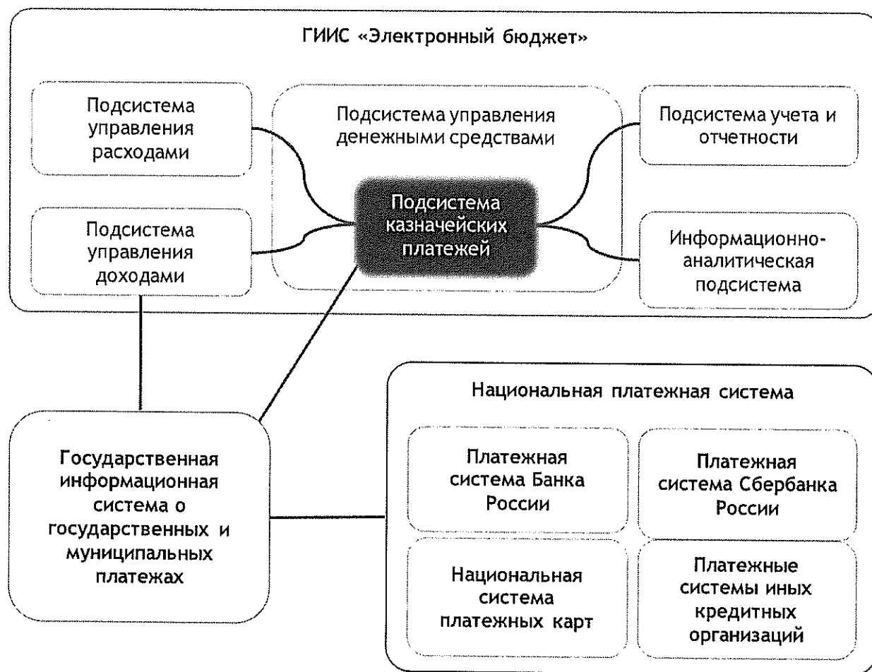
Схема 2. Место подсистемы казначейских платежей в ГИИС «Электронный бюджет» и ее взаимодействие с иными внутренними и информационными ресурсами

(начиная с 2020 г.) перспективной модели функционирования системы казначейских платежей (схема 2), основанной на использовании механизма единого казначейского счета, отражающего состояние и движение средств по счетам всех публично-правовых образований РФ. Его внедрение даст возможность существенно сократить сроки проведения расчетов из бюджетов всех уровней и ускорить оборачиваемость бюджетных средств. Решение этой задачи невозможно без принятия новой редакции Бюджетного кодекса РФ (либо внесения серьезных сущностных правок