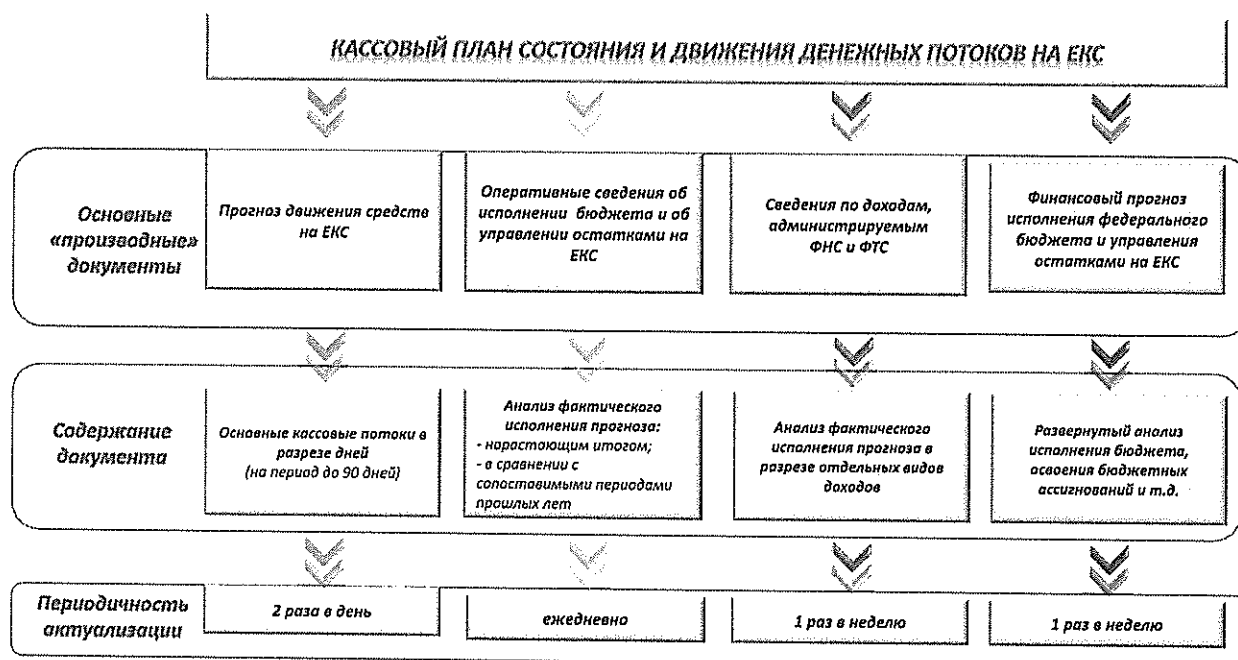
Схема 1. Комплексный анализ и мониторинг кассовых потоков на ЕКС

щего тренда инфляционных ожиданий) оказался практически полностью невостребованным при дюрации активных операций на срок, превышающий один месяц.